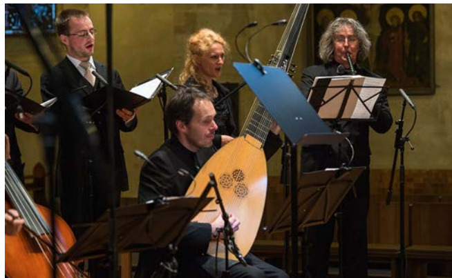
Johann Rosenmüller Ensemble