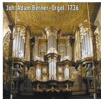
Joh. Adam Berner-Orgel, 1736

Kostenbeitrag pro Teilnehmer: 60,- € inkl. Besichtigung, Imbiss, Kaffee, Kuchen und Konzerteintritt Anmeldung und Information im Festivalabüro oder bei der Gesellschaft der Musikfreunde e.V.: info@musikfreunde.org oder unter der Telefonnummer: 0160-158-1122 (Herr Jansen)