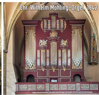
Chr. Wilhelm Möhling-Orgel, 1842